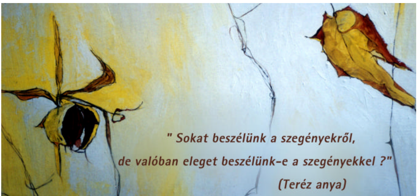
Valkó Rita plakátterve